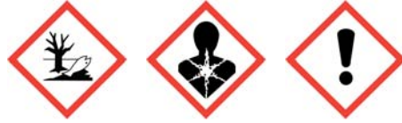
GHS09 GHS08 GHS07

according to the United Nations GHS (Rev. 4, 2011)